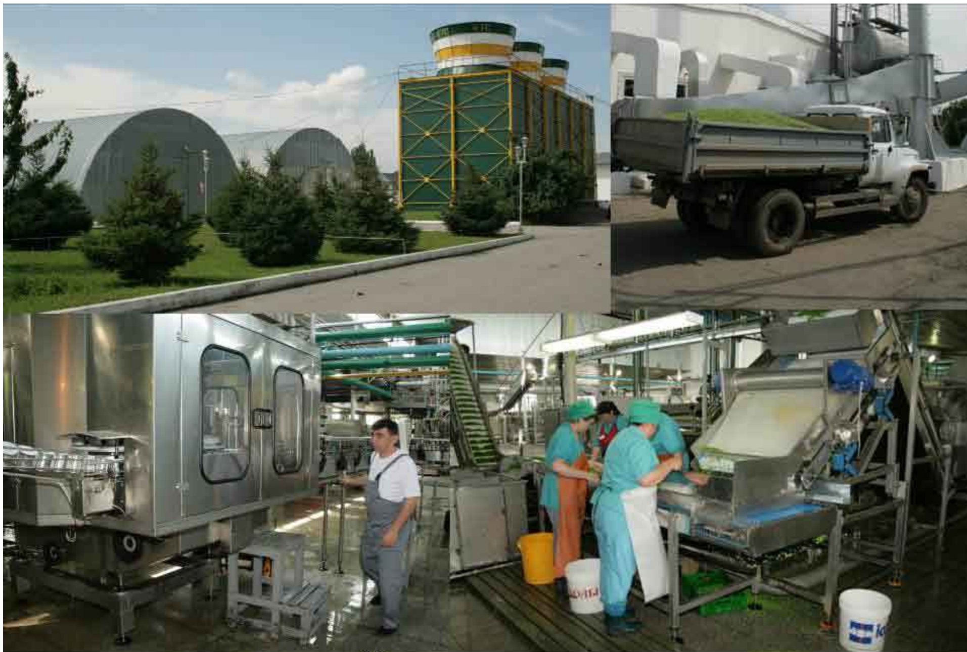
КОНСЕРВНЫЙ ЗАВОД "АГРО ПЛЮС"