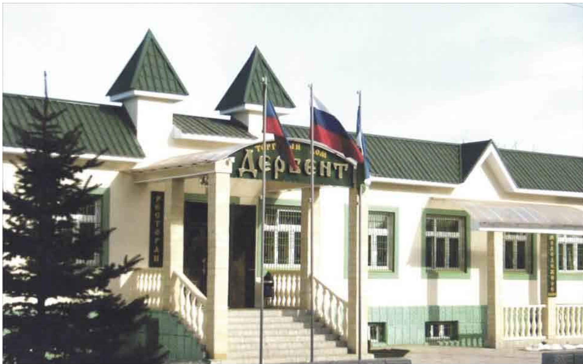
ТОРГОВЫЙ ДОМ "ДЕРБЕНТ"