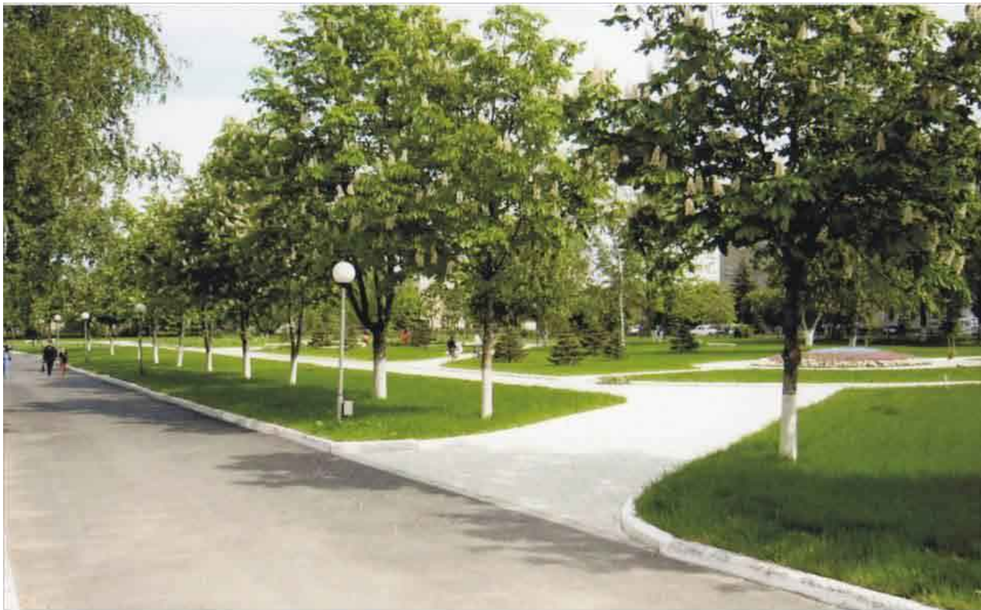
АЛЛЕЯ ПАРКА "КОМСОМОЛЬСКИЙ"