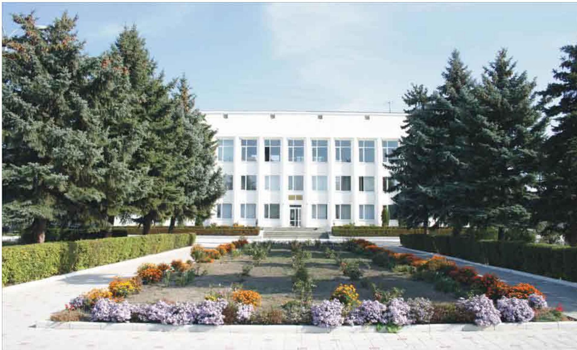
ЗДАНИЕ АДМИНИСТРАЦИИ ГОРОДА