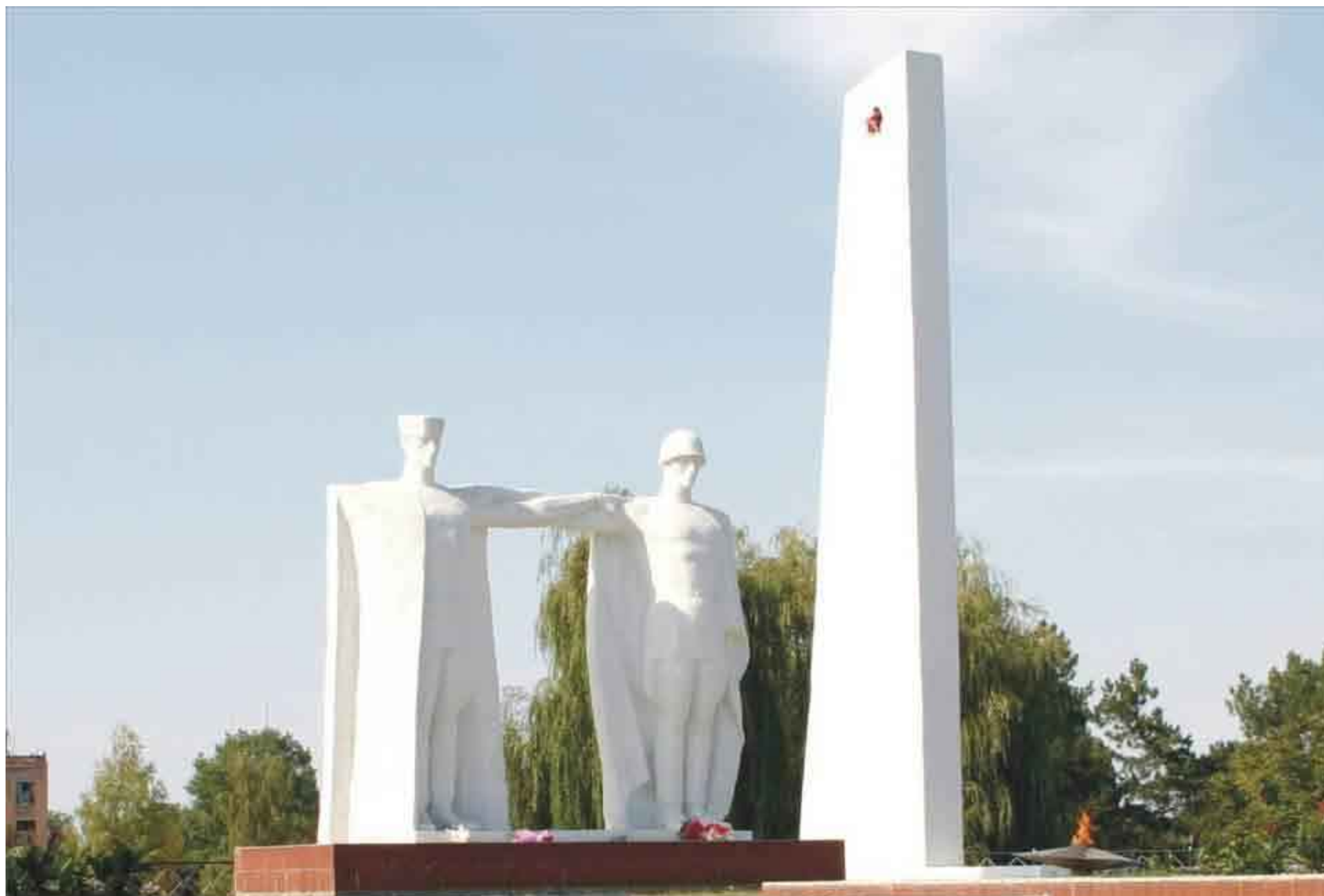
ПАМЯТНИК ПОГИБШИМ В ВОВ (1941-1945гг.)