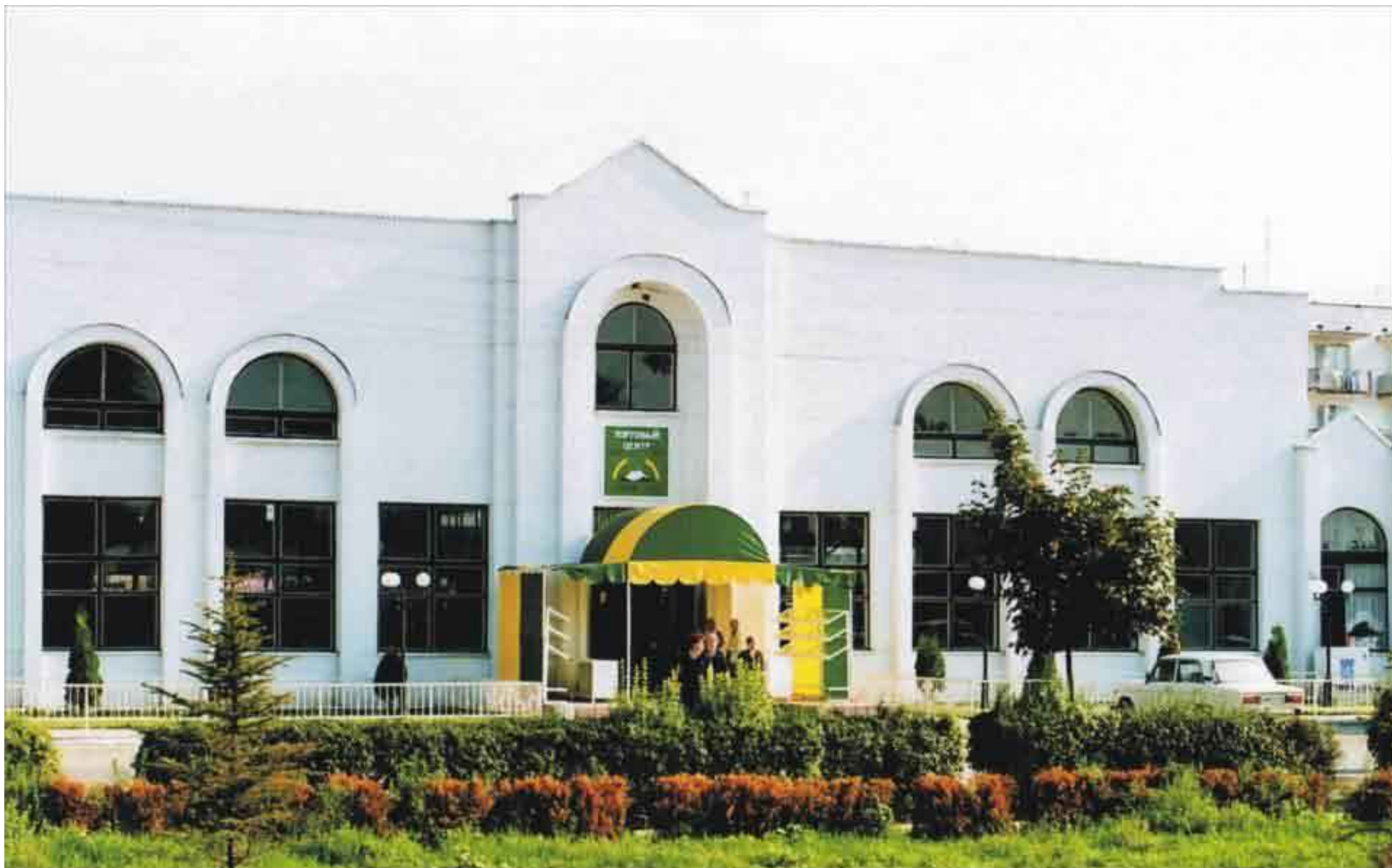
ТОРГОВЫЙ ЦЕНТР "ПРИВОКЗАЛЬНЫЙ"